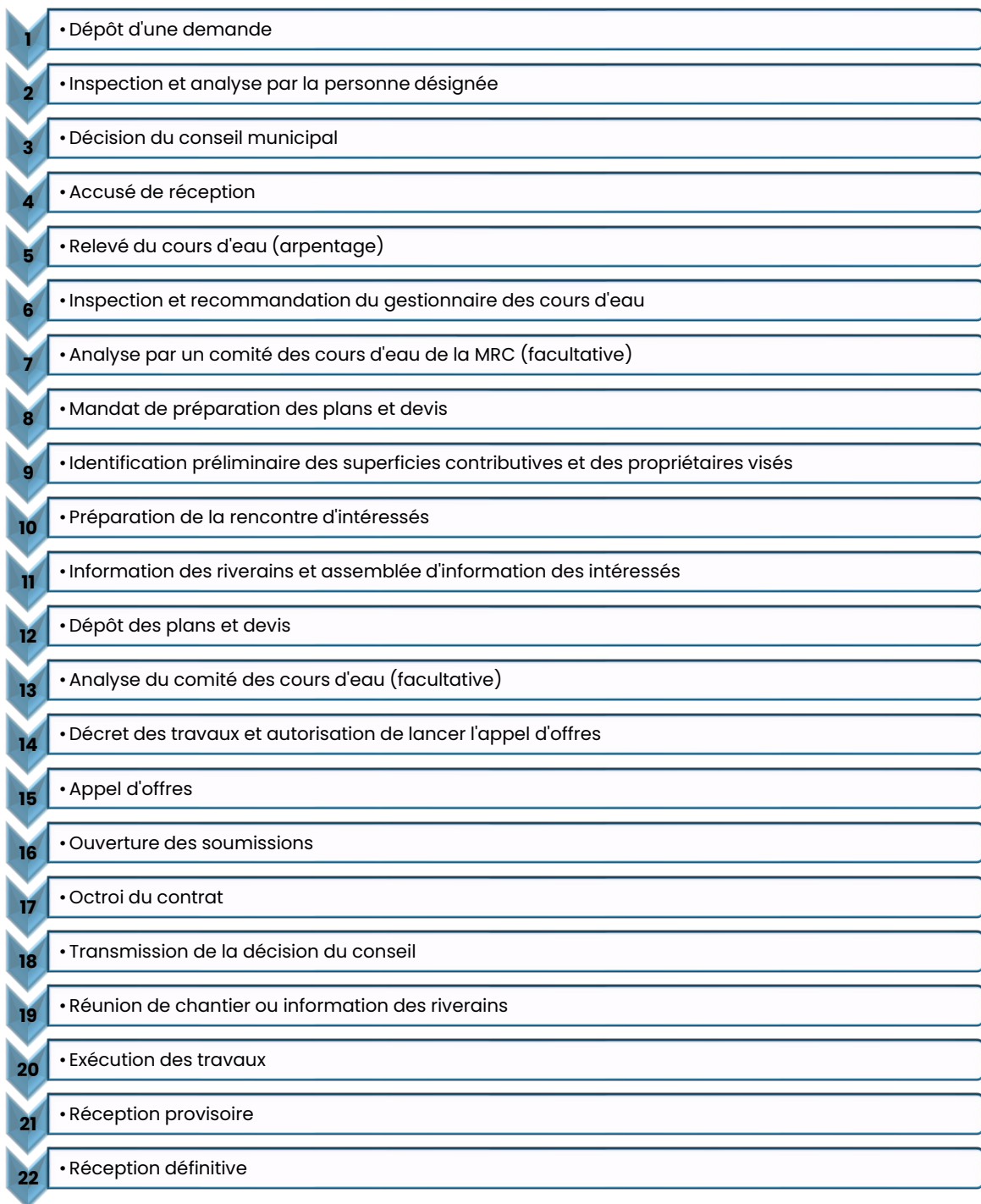
Figure 1 : Les différentes étapes du cheminement d'une demande d'intervention 16