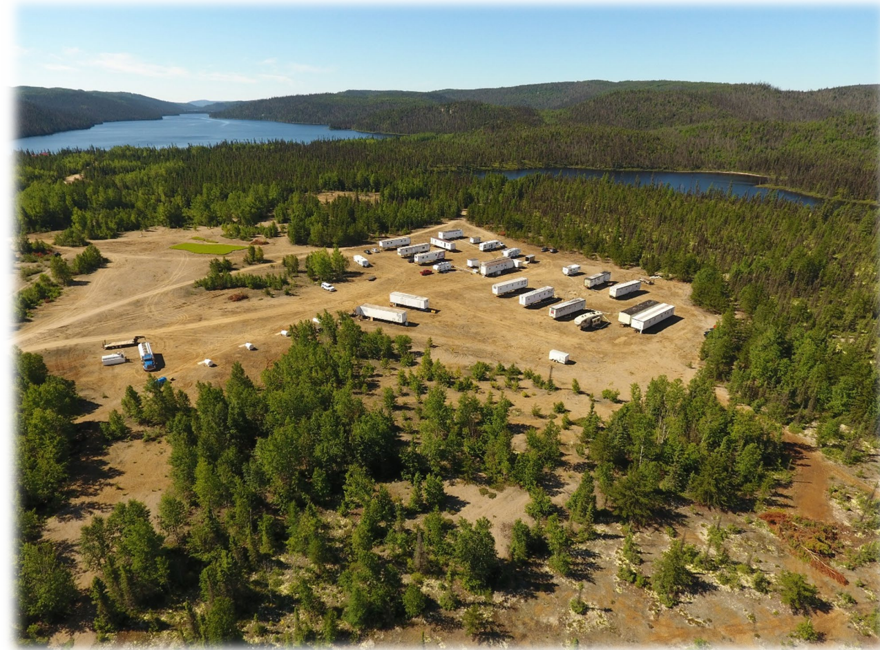
Kilomètres 124, route 389